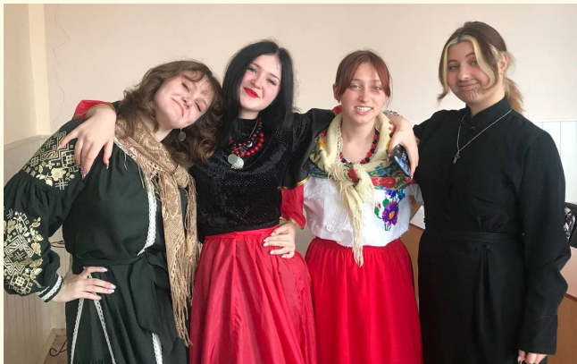
Студентки 11Ж перед виступом

Оргкомітет та студентська профспілка доклали максимум зусиль, щоб цей концерт був якнайкращим. Програма заходу була насиченою, що дозволило учасникам долучитися до свята зі своїми неповторними талантами та майстерністю. Від гітарних соло та дуетів фортепіано зі скрипкою до вишуканих співів, від комедійних сценок та опитувань до ретельно відточених хореографічних номерів – кожен виступ був особливим. Концертна програма була націлена на те, щоб вразити та надихнути, висловити вдячність та повагу своїм викладачам. Всі виступи студентів були